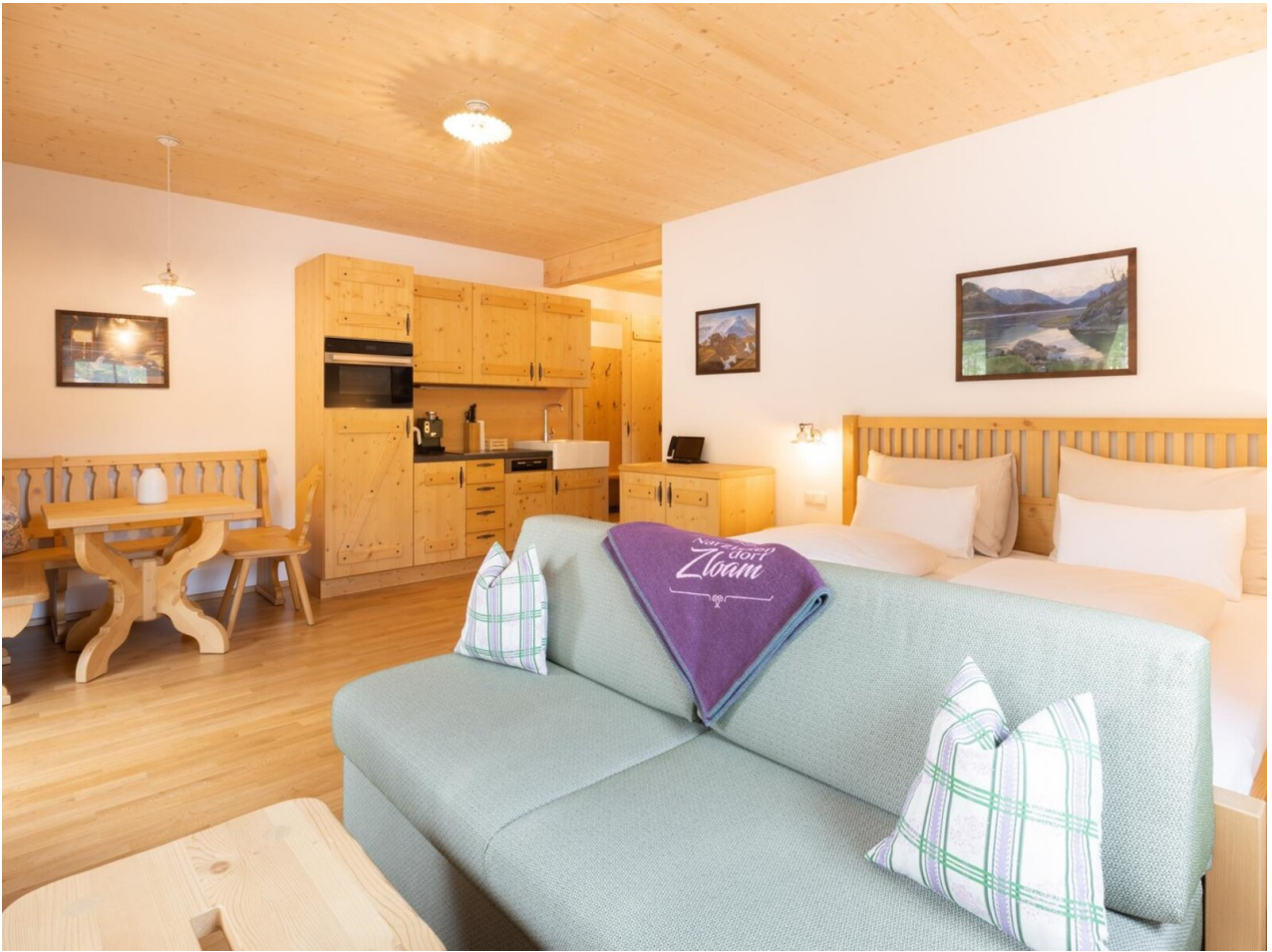
Wohnbeispiel Studio Tuba