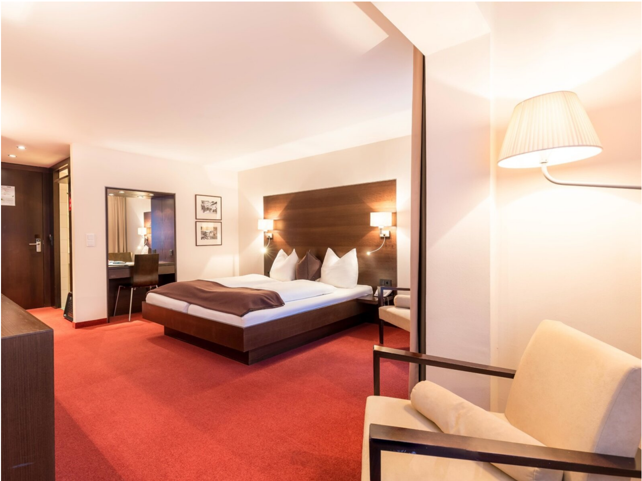
Wohnbeispiel Doppelzimmer Elegant