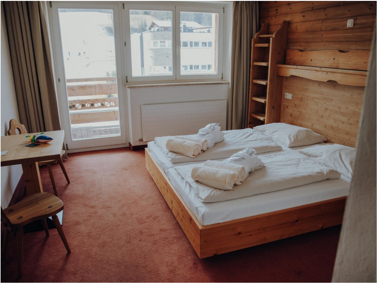
Wohnbeispiel Doppelzimmer Standard