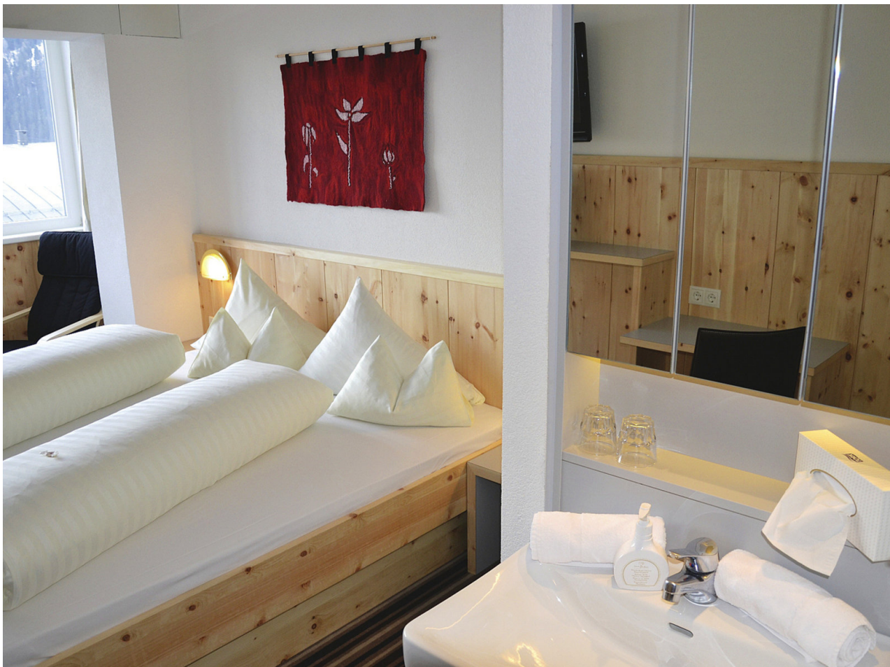
Wohnbeispiel Doppelzimmer Naturpark