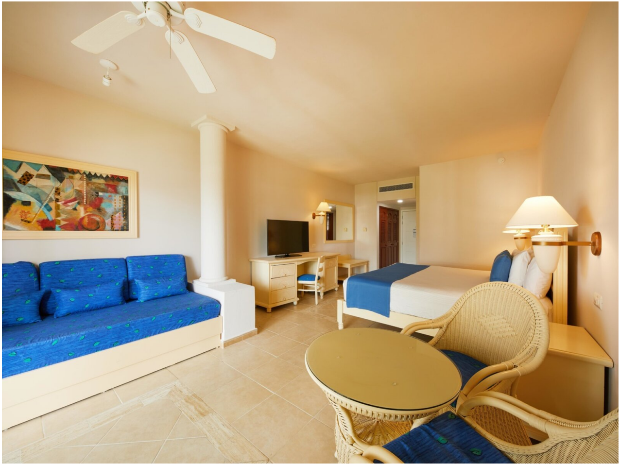
Wohnbeispiel Junior Suite