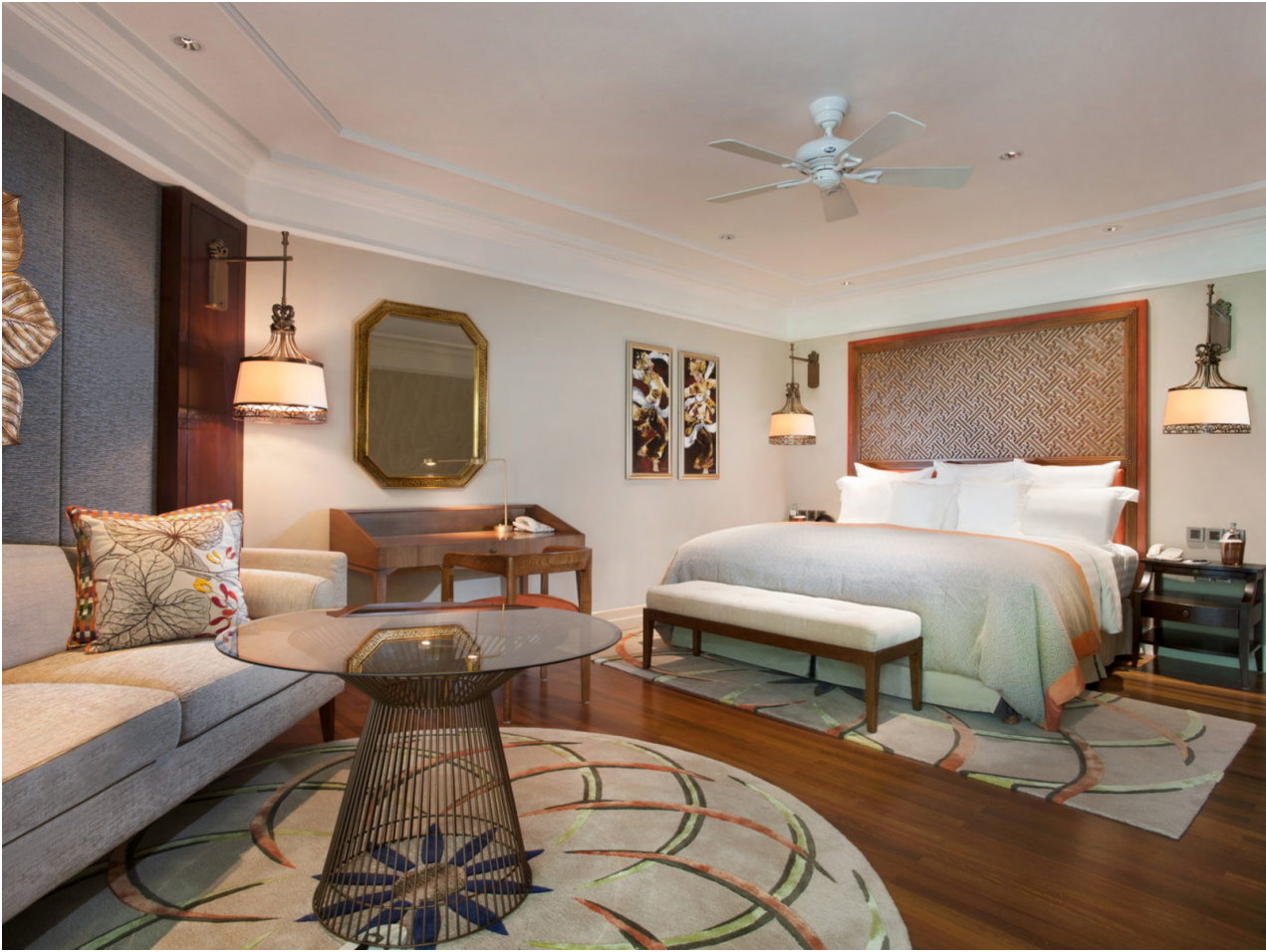
Wohnbeispiel Classic Garden View