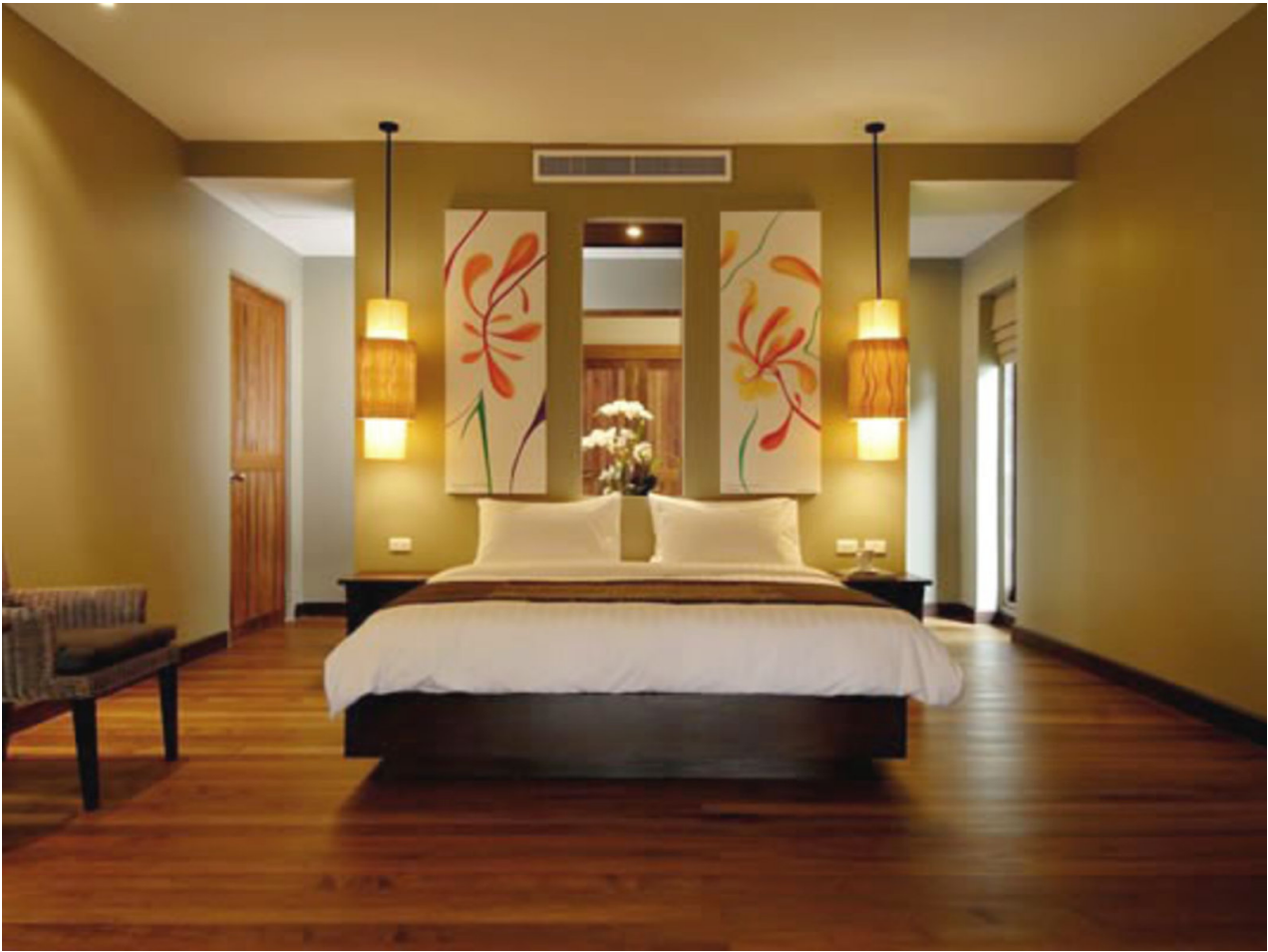
Wohnbeispiel Deluxe Room