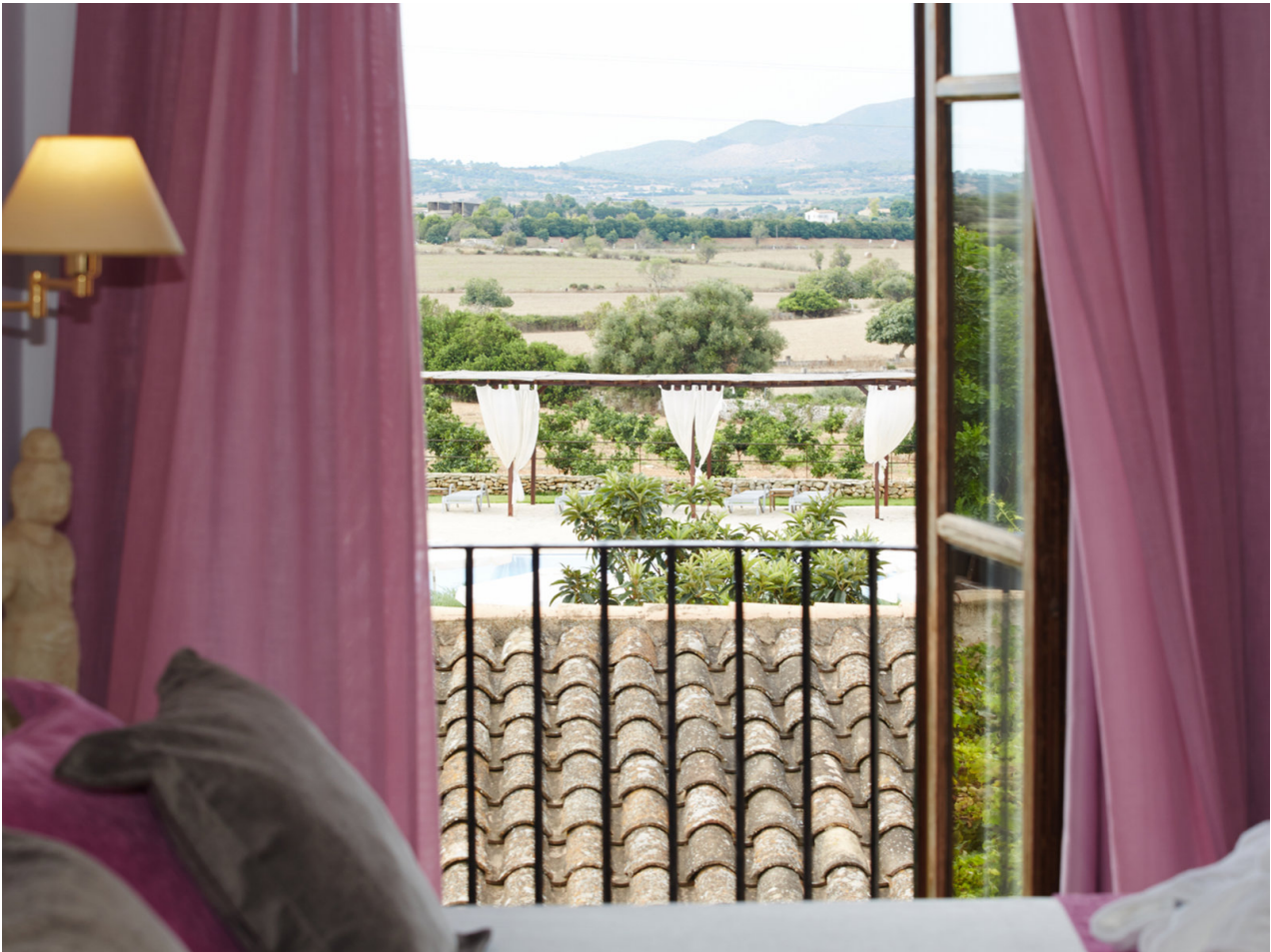
Wohnbeispiel Double Standard