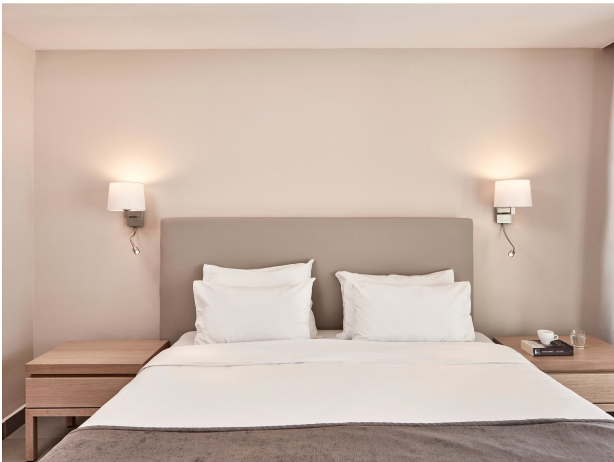
Wohnbeispiel Double Superior Inland View