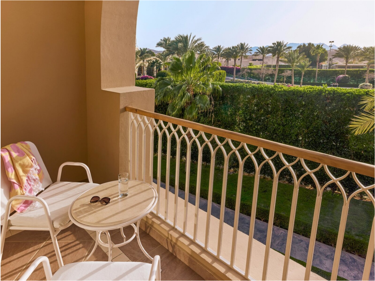
Wohnbeispiel Double Room Economy