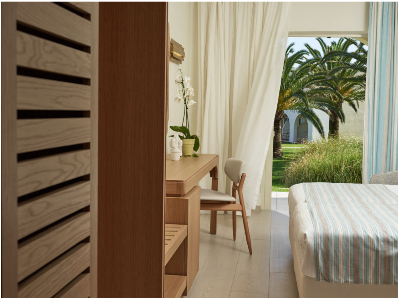
Wohnbeispiel Bungalow Beachside garden view