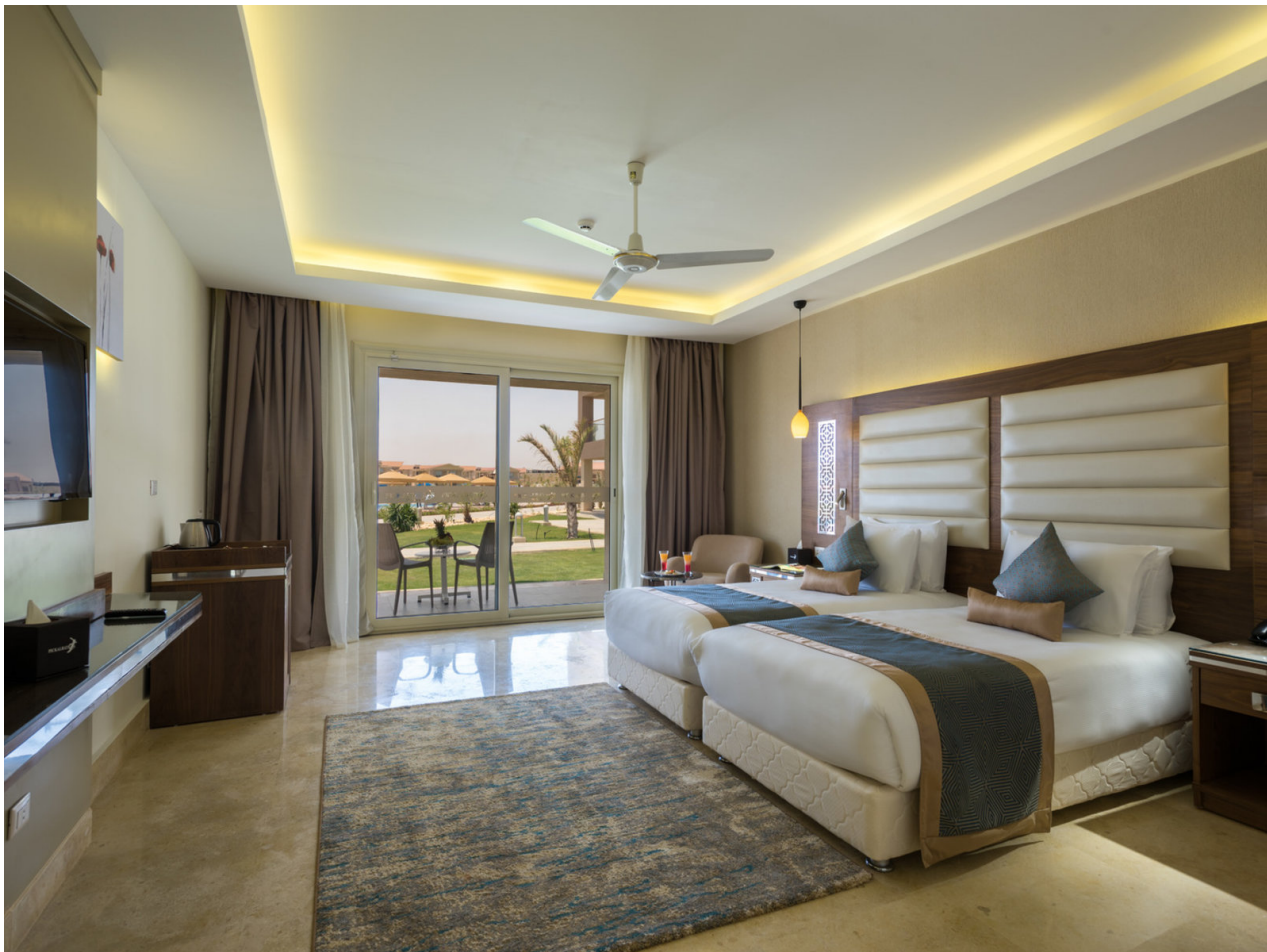
Wohnbeispiel Promotion Standard Garden View Room