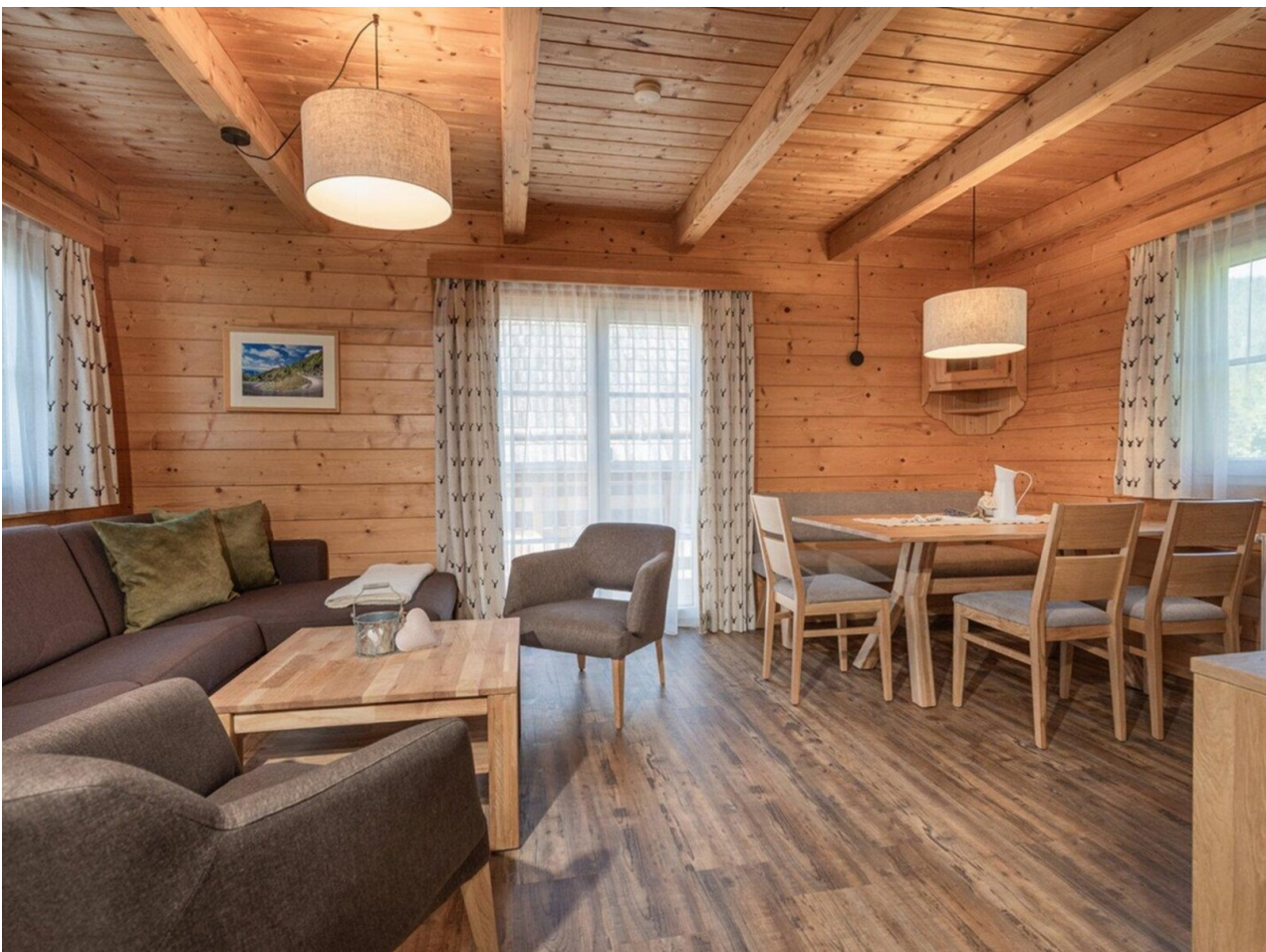
Wohnbeispiel Lodge Alpine Comfort 82qm, 4+2