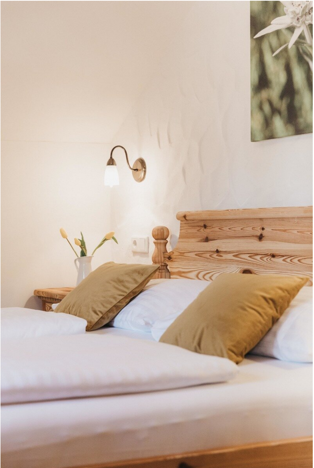
Wohnbeispiel App. Schwindelfrei