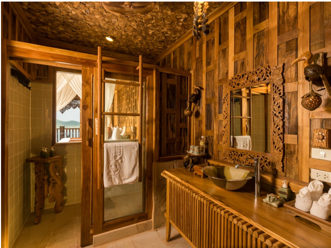
Wohnbeispiel Supreme Deluxe Bay View